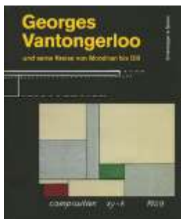
Georges Vantongerloo und seine Kreise von Mondrian bis Bill