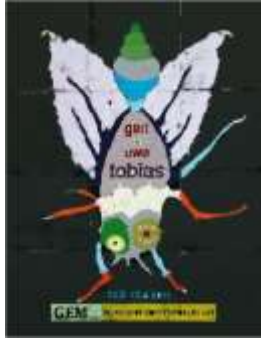
Gert und Uwe Tobias