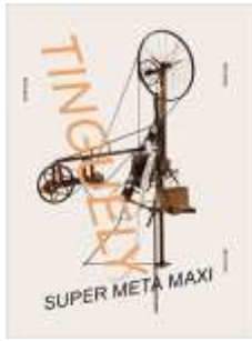
Tinguely: Super Meta Maxi

Museum Kunstpalast, Düsseldorf, Stedelijk Museum Amsterdam, Verlag Walther König, 2016 Thematische Texte, Vorwort; Übersetzungen aus dem Niederländischen und Englischen ins Deutsche