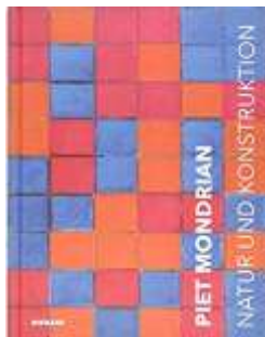
Piet Mondrian: Natur und Konstruktion

Artikel: Hans Jansen, Übersetzung aus dem Niederländischen ins Deutsche