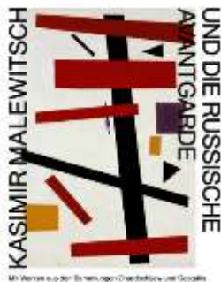
Kasimir Malewitsch und die russische Avantgarde

Alle Übersetzungen aus dem Niederländischen ins Deutsche