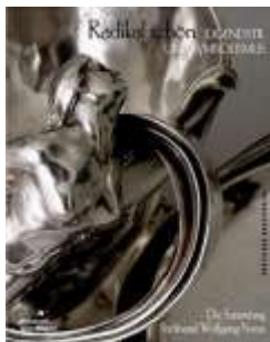
Radikal schön – Jugendstil und Symbolismus: Die Sammlung Ferdinand

Artikel: Paul Knolle, Übersetzung aus dem Niederländischen ins Deutsche