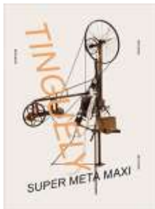
Tinguely: Super Meta Maxi

Alle Übersetzungen aus dem Niederländischen und Englischen ins Deutsche