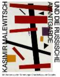
Kasimir Malewitsch und die russische Avantgarde

Bundeskunsthalle Bonn, Kerber Verlag, 2014