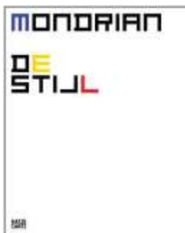
Mondrian und De Stijl

Alle Übersetzungen aus dem Niederländischen ins Deutsche