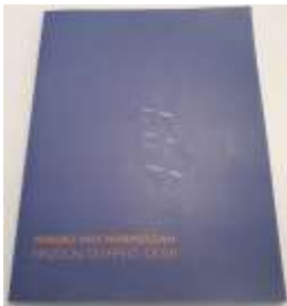
Einzeln, doppelt, quer

Alle Übersetzungen aus dem Niederländischen ins Deutsche