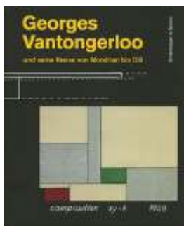
Georges Vantongerloo und seine Kreise von Mondrian bis Bill