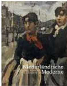
Niederländische Moderne: Die Sammlung Veendorp aus Groningen

Museum Kunstpalast, Düsseldorf, Stedelijk Museum Amsterdam, Verlag Walther König, 2016 Thematische Texte, Vorwort; Übersetzungen aus dem Niederländischen und Englischen ins Deutsche