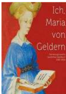
Ich, Maria von Geldern. Die Herzogin und ihr berühmtes Gebetbuch (1380-1429)