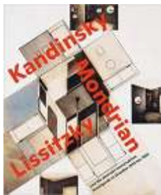
Zukunftsräume. Kandinsky, Mondrian, Lissitzky und die abstrakt-konstruktive Avantgarde in Dresden 1919 bis 1932