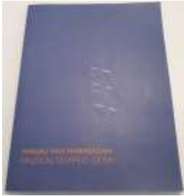
Einzeln, doppelt, quer

Alle Übersetzungen aus dem Niederländischen ins Deutsche