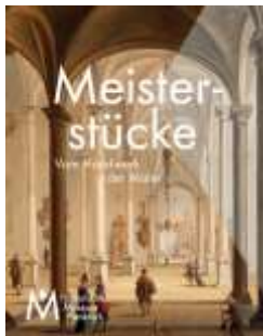
Meisterstücke – Vom Handwerk der Maler

Artikel: Matthias Depoorter; Wim De Clercq, Maxime Poulain, Jaume Coll Conesa, Jan Dymolyn; Übersetzungen aus dem Niederländischen ins Deutsche