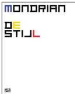
Mondrian und De Stijl

Alle Übersetzungen aus dem Niederländischen ins Deutsche