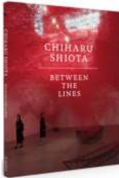
Chiharu Shiota | Between the lines

Hans November, Het Noordbrabants Museum, wbooks, 2017