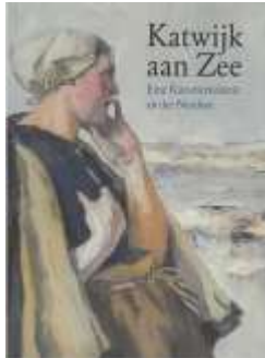
Katwijk aan Zee: Eine Künstlerkolonie an der Nordsee