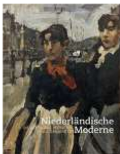
Niederländische Moderne: Die Sammlung Veendorp aus Groningen

Thematische Texte, Vorwort; Übersetzungen aus dem Niederländischen und Englischen ins Deutsche